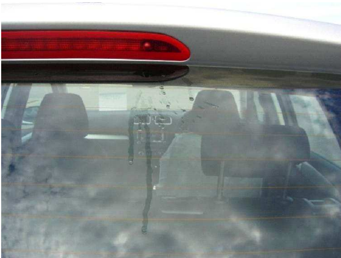
Obrázek 1) Příklad