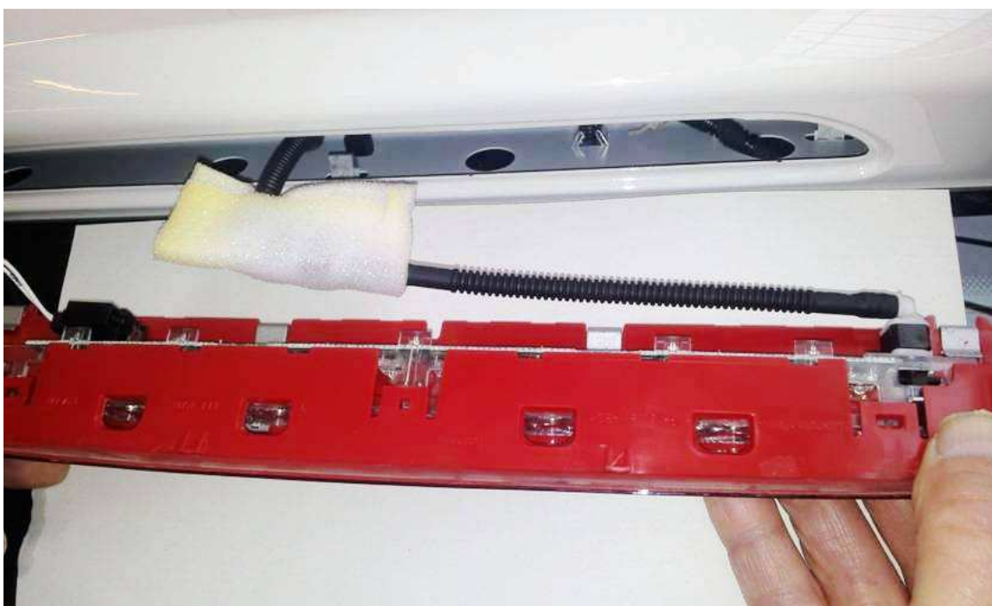
Obrázek 4) Příklad Golf: Příklad Golf: Přídavná brzdová svítlna s hadicí, zpětným ventilem a samolepicí pěnovkou (č. OD: 1J0 971 798 C).